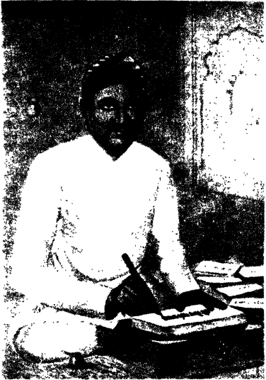
श्रीमान् पं० प्रवर टोडरमलजी